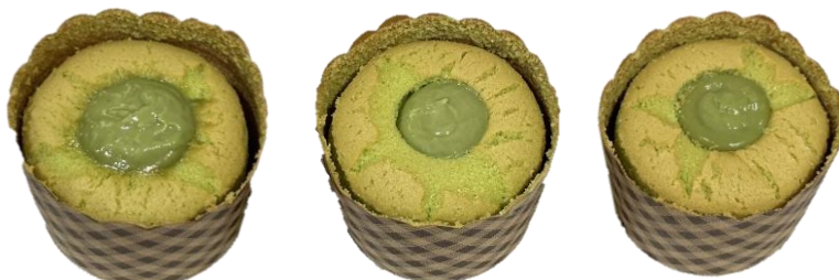
ลักษณะปกติ สปองจ์มีรอยแตก หรือร้อนจากขอบถ้วย