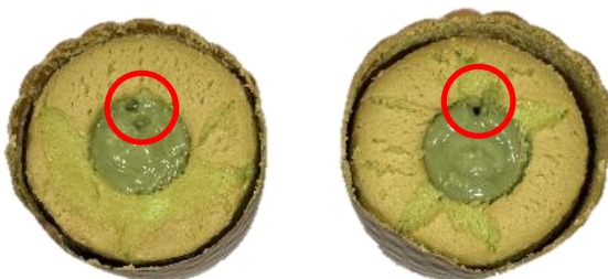
พบรูฟองอากาศที่ไส้ หรือสปองจ์ขนาดไม่เกิน 0.5 cm