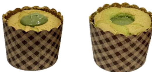
ไส้สูงสูงกว่าสปองจ์ หรือยุบลงจากสปองจ์ ไม่เกิน 1cm